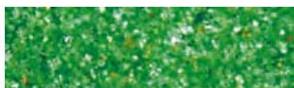
AFM Grade 1 0,50 mm – 1,00 mm Preis

AFM verkeimt 1 Mio. mal weniger als Quarzsand und verhindert somit nachhaltig die Bildung von Biofilm. Folglich deutlich geringerer Verbrauch von Desinfektionsmitteln.