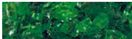
AFM Grade 3 2,00 mm – 6,00 mm